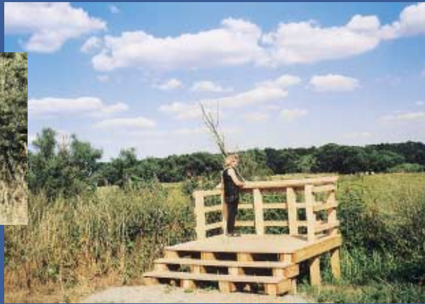
Ein Blick über die Altarme ist lohnenswert.

Nicht weit von Diderse liegt am rechten Okerufer der Ort Hillerse. Hier lohnt sich eine Besichtigung der Kapelle mit ihrem spätgotischen Schnitzaltar, die um 1500 erbaut wurde. Sehenswert ist ebenso die Modelleisenbahnschau des Modellbahnclubs Gifhorn-Hillerse.