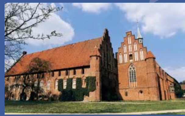
Zisterzienserinnenkloster in Wienhausen

Hinter dem Abzweig des Mühlenkanals bietet das Gasthaus und der Campingplatz "Allerparadies" eine ideale Übernachtungsmöglichkeit (mit Bootslager, Leihfahrrädern und Freibad).