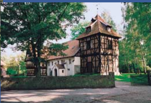
Kirche in Müden