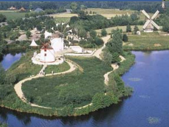
Internationaler Wind- und Wassermühlenpark